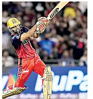
मुकेश्वर के आगे विखरी गुंबई इंडियंस... पृष्ठ 7 पर

दीपक बोलता नहीं उसका प्रकाश परिचय देता है, टीक उसी प्रकार आप अपने बारे में कुछ न बोलें, बस अच्छे कर्म करते रहें वही आपका परिचय देंगे।