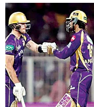
एलन-रघुवंशी के तूफान में उड़ी गुजरात, जीत के साथ कोलकाता ने प्लेऑफ की उम्मीदों को रखा जिंद...