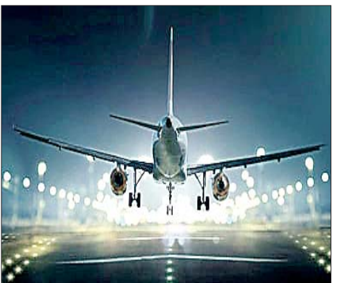
यह फैसला पश्चिम एशिया में जारी संघर्ष के कारण वैश्विक स्तर पर ईंधन की कीमतों को लेकर बनी अनिश्चितता के बीच लिया गया है।

एक आधिकारिक बयान के अनुसार, मुख्यमंत्री रेखा गुप्ता की अध्यक्षता में हुई मंत्रिमंडल की बैठक में विमान ईंधन पर मूल्य वृद्धि कर 25 प्रतिशत से घटाकर सात प्रतिशत करने का निर्णय लिया गया।