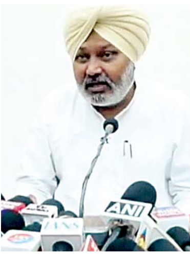
वारे में मीडिया के सवालों का जवाब देते हुए

केंद्रीय मंत्री रवनीत सिंह बिट्टू द्वारा मुख्यमंत्री भगवंत मान को आईएसआई एजेंट कहने के