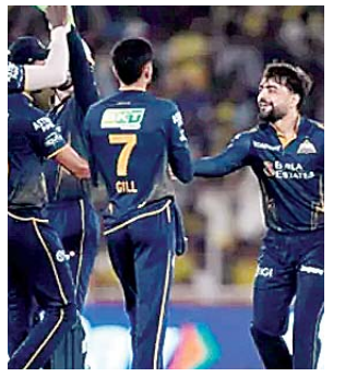
वेनई सुए किंग्स का सफर हुआ सफल... पृष्ठ 7 पर

वाणी और पानी दोनों में छवि नजर आती है, पानी स्वच्छ हो तो चित्र नजर आता है, और वाणी मधुर हो तो चरित्र नजर आता है।