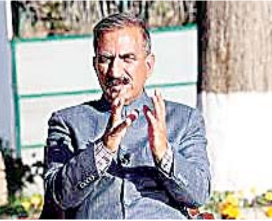
को नशे की दलदल में जाने से रोकने के लिए पंचायती राज और पुलिस विभाग को विशेष

प्रदेश को चिट्ठा मुक्त बनाने के अभियान की सफलता के लिए एक व्यापक योजना तैयार कर उसे प्रभावी ढंग से लागू किया जा रहा है। प्रदेश के युवाओं