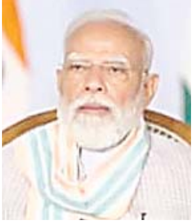
युवाओं से पीएम को बड़ी उम्मीद

प्रधानमंत्री नरेंद्र मोदी ने आज 19वें रोजगार मेले में वीडियो कॉन्फ्रेंसिंग के जरिए 51000 से अधिक लोगों को नियुक्ति पत्र बांटे। इन सभी लोगों की विभिन्न सरकारी विभागों और संगठनों में हाल ही में नियुक्ति हुई है। पीएम मोदी ने इस दौरान अपनी हाल के पांच देशों की यात्रा का भी जिक्र किया। पीएम ने देश की युवाओं की तारीफ करते हुए कहा कि दुनिया भारत के युवाओं और भारत की टेक्नोलॉजिकल प्रोग्रेस को लेकर बहुत उत्साहित है। आज दुनिया भारत की विकास यात्रा का हिस्सा बनना चाहती है। पीएम ने कहा कि देश के नौजवानों को ग्लोबल एक्सपोजर भी मिले।