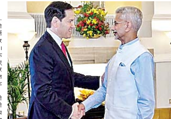
श्रृंखला में हमारे सहयोग को और गहरा करना है। इसमें माइनिंग, प्रोसेसिंग, रीसाइक्लिंग और संबंधित निवेश शामिल हैं। विदेश मंत्री ने कहा कि यह डील एक मजबूत और विविध आपूर्ति श्रृंखला बनाने में मदद करेगा, प्रोजेक्ट्स की फंडिंग में

उन्होंने कहा कि इसका मकसद अहम खनिजों और रेयर अर्थ की पूरी आपूर्ति