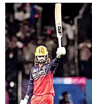
रघुत पाटीदार के तूफान से लगातार दूसरी बार फाइनल में RCB... >> पृष्ठ 7 पर

जालंधर, वर्ष: 16 अंक : 145 दिनांक : बुधवार, 27 मई 2026 सम्पादक : वितेक धीर सम्पर्क : 97796-00900 पन्ने - 8 मूल्य: ₹ 2.00/- RNI No | PUNHIN/2010/36540