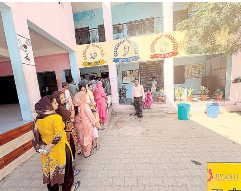
प्रथम न्यूज। पट्टा मेहलोला 26 मई