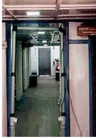
सचिव स्टाफ के साथ बैठेंगे। अस्थायी कार्यालयों से होगा कामकाज - फिलहाल बैठने की व्यवस्था

प्रस्तावित कार्यालय में मुख्यमंत्री की सुरक्षा टीम के जवान तैनात हो गए हैं। प्रवेश द्वार पर आगंतुकों की जांच के लिए मेटल डिटेक्टर स्थापित कर दिया है। इसके साथ ही आगंतुकों के बैठने के लिए वेंटिंग रूम में व्यवस्था कर दी गई है। मुख्यमंत्री के अतिरिक्त प्रधान निजी