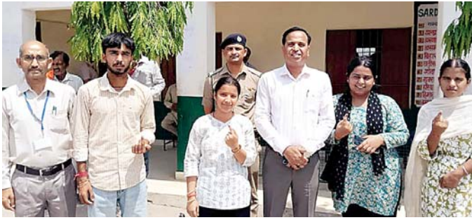
प्रथम न्यूज | नालागढ़ 28 मई (गुरजीत सिंह)

शांतिपूर्ण माहौल में संपन्न हुआ द्वितीय चरण