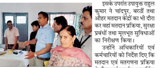
मतदाता सहज वातावरण में अपने मतदाधिकार का प्रयोग कर सकें। निरीक्षण के दौरान उपायुक्त ने मतदान केंद्रों पर पहुंचे मतदाताओं से बातचीत कर व्यवस्थाओं के संबंध

उन्होंने बताया कि मॉडल पोलिंग स्टेशनों पर मतदाताओं की सुविधा के लिए हेल्थ डेस्क, स्वास्थ्य जांच सुविधा, बैठने की समुचित व्यवस्था, पेयजल तथा बच्चों के लिए क्रेच सुविधा उपलब्ध कराई गई है ताकि