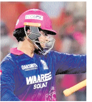
वैभव सूर्यवंशी अजर अविश्वान में उल्टे तो दूटेंगे सभी रिश्तों! वीडियो सहवाग ने बताया कितने करोड़...

रिश्तों की सबसे बड़ी ताकत विश्वास और सम्मान है, इन्हें हमेशा दिल से निगाना चाहिए।