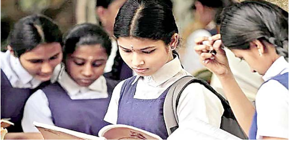
आत्मनिर्भरता की आधारशिला बन सकती है।

नई शिक्षा नीति 2020 ने इस दिशा में प्रगति हासिल की है। जापान, दक्षिण कोरिया, चीन, जर्मनी और फ्रांस जैसे देशों ने अपनी भाषाओं में वैज्ञानिक और तकनीकी साहित्य विकसित किया तथा शिक्षा को अपनी सांस्कृतिक आवश्यकताओं के अनुरूप ढाला। परिणामस्वरूप वे न केवल तकनीकी क्षेत्र में आगे बढ़े, बल्कि वैश्विक ज्ञान उत्पादन में भी महत्वपूर्ण योगदान दे सके। भारत के लिए भी यह आवश्यक है कि वह अपनी भाषाओं को आधुनिक ज्ञान-विज्ञान के वाहक के रूप में विकसित करे।