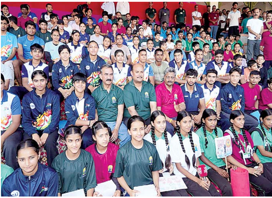
सरकार ने इंटरनेशनल प्रतियोगिताओं के पदक विजेताओं के लिए करोड़ों रुपए की पुरस्कार राशि का प्रावधान

मुख्यमंत्री ठाकुर सुखविन्द सिंह सुवखू ने जिला हमीरपुर के अणु स्थित साई के सेंटर आफ एक्सिलेंस के प्रशिक्षुओं एवं युवा खिलाड़ियों तथा कोचों को वरल्ड क्लास सुविधाएं प्रदान करने के लिए कृत संकल्प है। इस क्रम में नाटौन में लगभग 125 करोड़ रुपए का अत्याधुनिक इंडोर स्टेडियम बनाया जा रहा है, जिसे इसी वर्ष प्रदेश के खिलाड़ियों को समर्पित कर दिया जाएगा। इसमें तैक्वांडो, बैडमिंटन, बॉलीबॉल और टेनिस सहित 14 खेलों के लिए विश्व स्तरीय सुविधाएं उपलब्ध करवाई जाएंगी। राज्य स्तरीय योग दिवस समारोह एवं योगाभ्यास सत्र में भाग लेने के बाद खिलाड़ियों के साथ संवाद के दौरान मुख्यमंत्री ने कहा कि प्रदेश