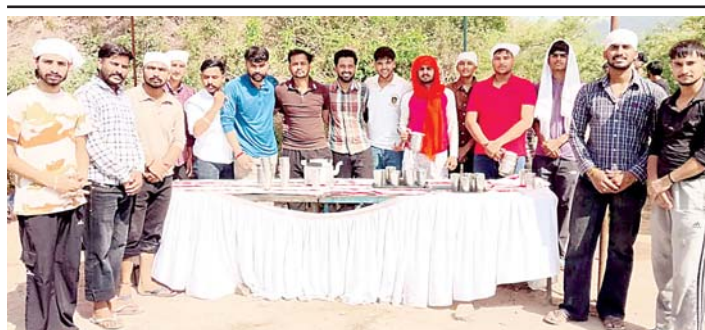
दून क्षेत्र के नलपुर गांव के युवाओं ने कोटला से गुरुद्वारा श्री हरिपुर साहिब रोड पर राहगीरों के लिए टंडे नीट जल की छबील लगाई।