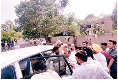
कालिया की बिगड़ी तबीयत, अस्पताल में भर्ती

जालंधर में शिलान्यास कार्यक्रम के दौरान पूर्व मंत्री मनोरंजन