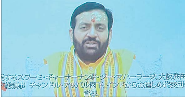
श्रीमद्भगवद्गीता महोत्सव में भाग लेने वाले मुख्यमंत्री श्री नायब सिंह सैनी

हरियाणा के मुख्यमंत्री श्री नायब सिंह सैनी ने कहा कि श्रीमद्भगवद्गीता केवल एक धार्मिक ग्रंथ नहीं, बल्कि मानव जीवन को सही दिशा देने वाली एक अमूल्य धरोहर है। कुरुक्षेत्र की पावन भूमि पर भगवान श्रीकृष्ण द्वारा दिया गया कर्मयोग का संदेश आज भी पूरी मानवता के लिए प्रेरणास्रोत है। गीता हमें कर्तव्य, आत्मविश्वास, संयम और मानव कल्याण का मार्ग दिखाती है।