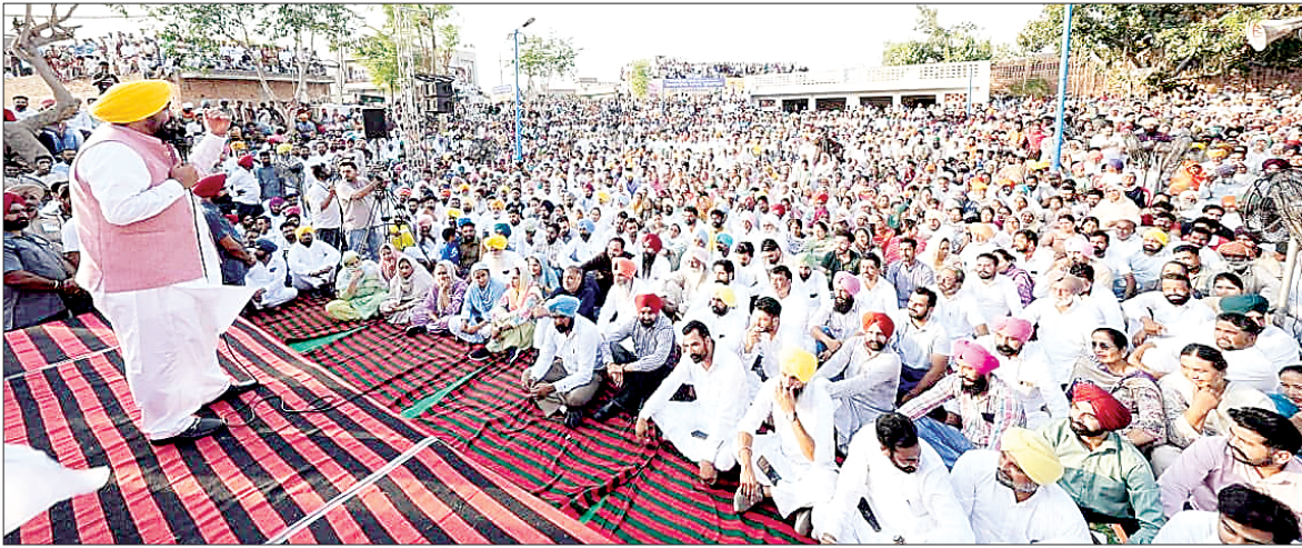
से नहीं हुए हैं और इस संबंध में उन्होंने केंद्र सरकार को पत्र लिखकर जल्द चुनाव कराने की मांग की है। मान ने कहा कि धार्मिक संस्थाओं

मौड़ हलके के ऐतिहासिक गांव मंडी कला में आयोजित विशाल 'लोक मिलनी' कार्यक्रम के दौरान पंजाब के मुख्यमंत्री भगवंत सिंह मान ने दावा किया कि शिक्षा क्षेत्र में व्यापक सुधारों के चलते पंजाब ने स्कूली शिक्षा के मामले में केरल, महाराष्ट्र और दिल्ली जैसे राज्यों को पीछे छोड़कर देश में पहला स्थान हासिल किया है। उन्होंने कहा कि उनकी सरकार शिक्षा, कृषि, महिला सशक्तिकरण और धार्मिक आस्था के सम्मान को समान प्राथमिकता दे रही है। मुख्यमंत्री ने कहा कि श्री अकाल तख्त साहिब हर पंजाबी और सिख के लिए सर्वोच्च और अत्यंत पवित्र संस्था है, लेकिन कुछ लोग अपने निजी हितों के लिए इसका दुरुपयोग करने का प्रयास कर रहे हैं। उन्होंने बताया कि शिरोमणि गुरुद्वारा प्रबंधक कमेटी (एसजीपीसी) के चुनाव पिछले 14 वर्षों