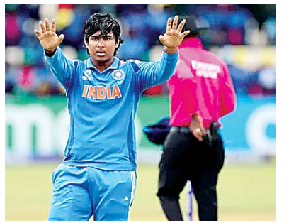
वैभव सूर्यवंशी पर इन्वेंडें में लगा अनोखा नियम! टीम इंडिया के साथ शेयर नहीं कर पाएंगे ड्रेसिंग रूम... >> पृष्ठ 7 पर

रिश्तों की कट्टर भी पैसों की तरह ही करनी चाहिए क्योंकि दोनों को कमाना मुश्किल है पर गँवाना आसान।