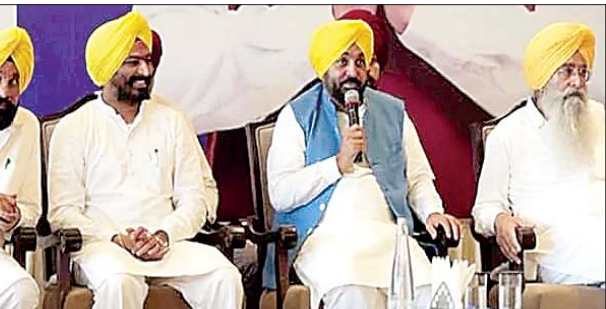
2027 को देश को आजाद हुए 80 साल हो जाएंगे। 15 अगस्त को देश आजाद हुआ और देश में लोकतंत्र की नींव रखी गई। लोकतंत्र की नींव की पहली ईंट सरपंच होते हैं, लेकिन सरपंचों को ही सबसे ज्यादा बदनाम करके रख दिया गया है। भगवंत सिंह मान ने कहा कि सरपंच मुझे अपना छोटा-बड़ा भाई, बेटा या भतीजा समझें। इस 15 अगस्त से हर एक सरपंच के खाते में 10 हजार रुपये मिला करेंगे। इसे 10 हजार रुपये मानदेय कह लें, वेतन कह लें या चाय-पानी कह लें, जो मर्जी कह लें, अब सरपंचों को हर महीने 10 हजार रुपये मिला करेंगे। जनकल्याण के लिए और बड़े फैसले लेगी मान सरकार

बटिंडा में आयोजित सरपंच मिलनी कार्यक्रम को संबोधित करते हुए सीएम भगवंत सिंह मान ने कहा कि 15 अगस्त को देश आजाद हुआ था और 15 अगस्त