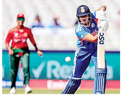
शेफाली वर्मा की आंखों में उड़ी बांग्लादेश, भारत की धमाकेदार जीत; सेमीफाइनल की उम्मीदें कायम... >> पृष्ठ 7 पर