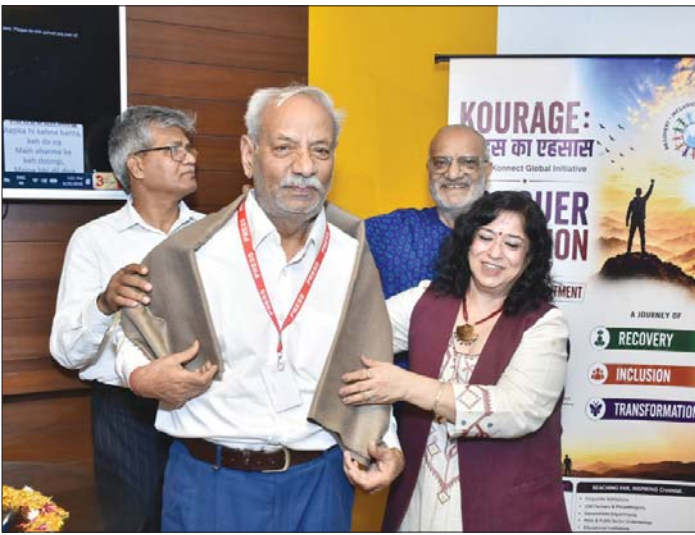
» प्रथम न्यूज | चंडीगढ़ 27 जून (बी. शर्मा)