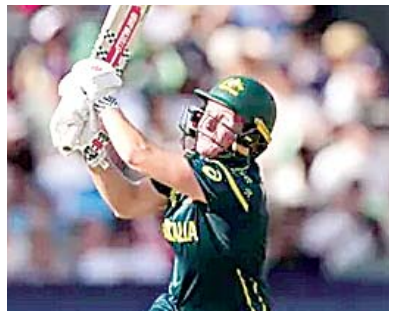
टूट गया इंग्लैंड का साफना, फाइनाल में ऑस्ट्रेलिया ने नाटी बाजी; रिकॉर्ड 7वीं बार टोपी पर जमाया कब्जा... >> पृष्ठ 7 पर

सपने वो नहीं जो हम सोते हुए देखते हैं, सपने वो हैं जो हमें सोने नहीं देते। - डॉ. ए.पी.जे. अब्दुल कलाम