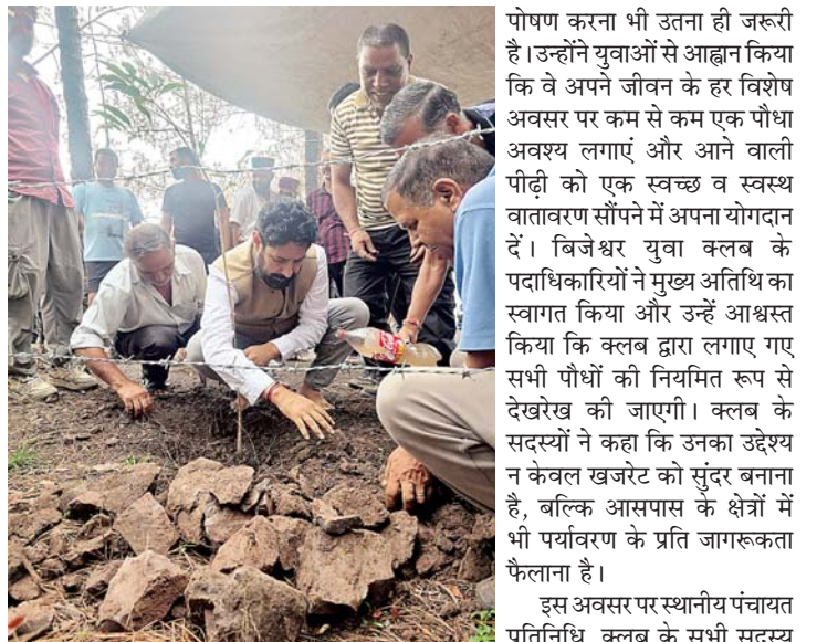
रखना हमारी सबसे बड़ी जिम्मेदारी है। केवल पौधे लगाना ही काफी नहीं है, बल्कि उन्हें जीवित रखना और उनका पालन-