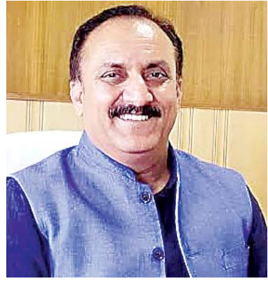
किए गए रोजगार के वादों का क्या हुआ और नियमित भर्ती प्रक्रिया क्यों ठप पड़ी हुई है।