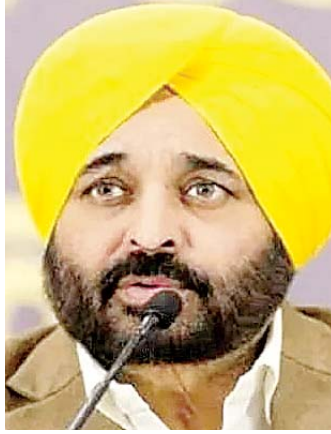
नागरिक को एसआईआर फॉर्म भरने में कठिनाई आती है तो वह आम आदमी पार्टी के स्थानीय स्वयंसेवकों से सहायता

पंजाब के मुख्यमंत्री भगवंत सिंह मान ने राज्य के सभी पात्र मतदाताओं से मतदाता सूचियों के विशेष गहन पुनरीक्षण (एसआईआर) अभियान में समय पर भाग लेने और एसआईआर फॉर्म भरने की अपील की है। उन्होंने कहा कि नई मतदाता सूची में नाम दर्ज रहने से ही नागरिक अपने संवैधानिक मतदान के अधिकार का उपयोग कर सकेंगे। साथ ही उन्होंने कहा कि सरकार की विभिन्न कल्याणकारी योजनाओं, विशेषकर 6मांवा-धियां सत्कार योजना% का लाभ लंगर प्राप्त करने के लिए भी इस प्रक्रिया को पूरा करना आवश्यक है।